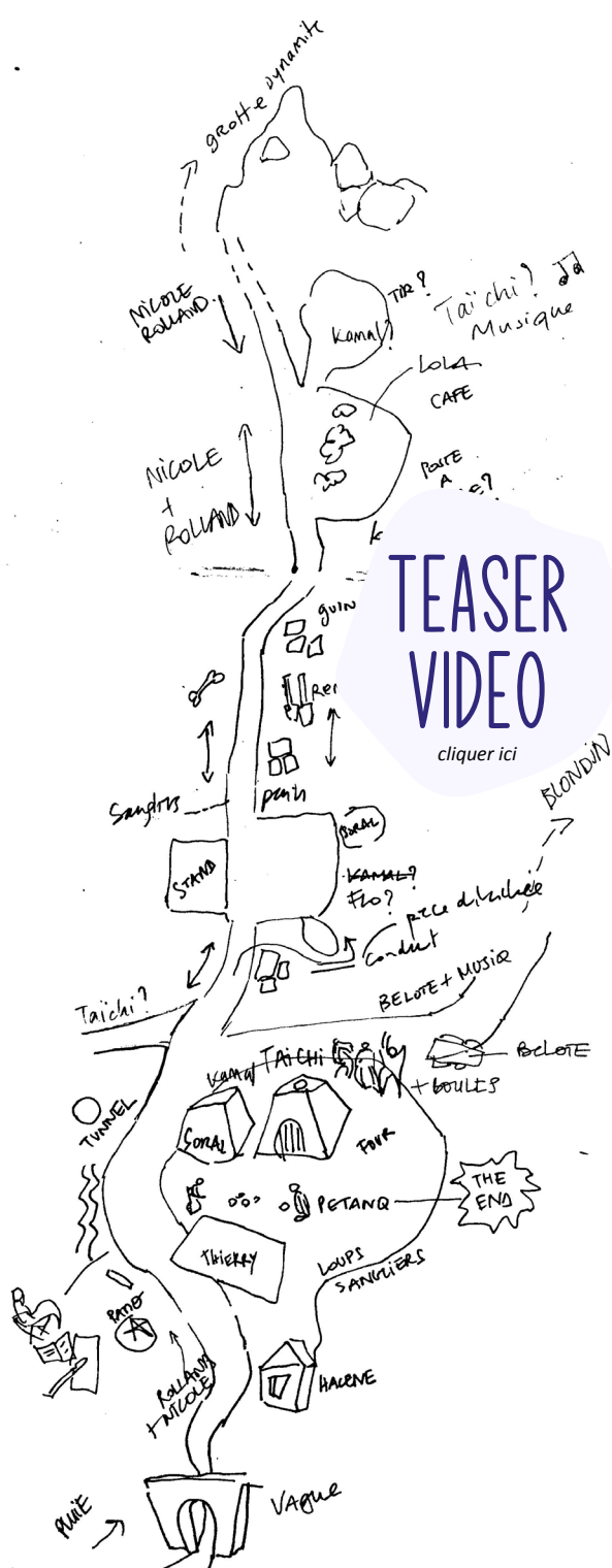
Ci-dessus : croquis de travail, version #1

Grandeur nature est un projet de création in-situ : il est (re)pensé spécifiquement pour chaque nouveau territoire d'accueil.