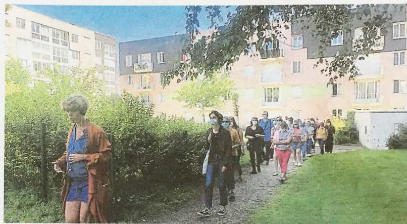
Au fil de la déambulation dans le quartier, on déambule aussi à travers les vies des habitants de la Liberté, à la fois personnages principaux et figurants.

L'usine revient régulièrement, notamment devant l'ancien site de Big Chief, le fleuron du textile qui